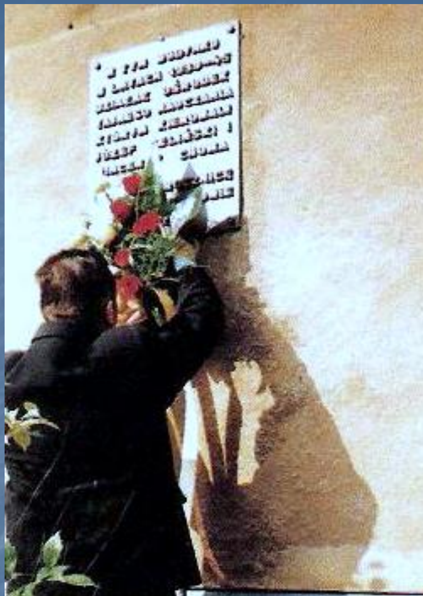
Uroczystość zakończyła się złożeniem kwiatów pod tablicą upamiętniającą nauczycieli TON