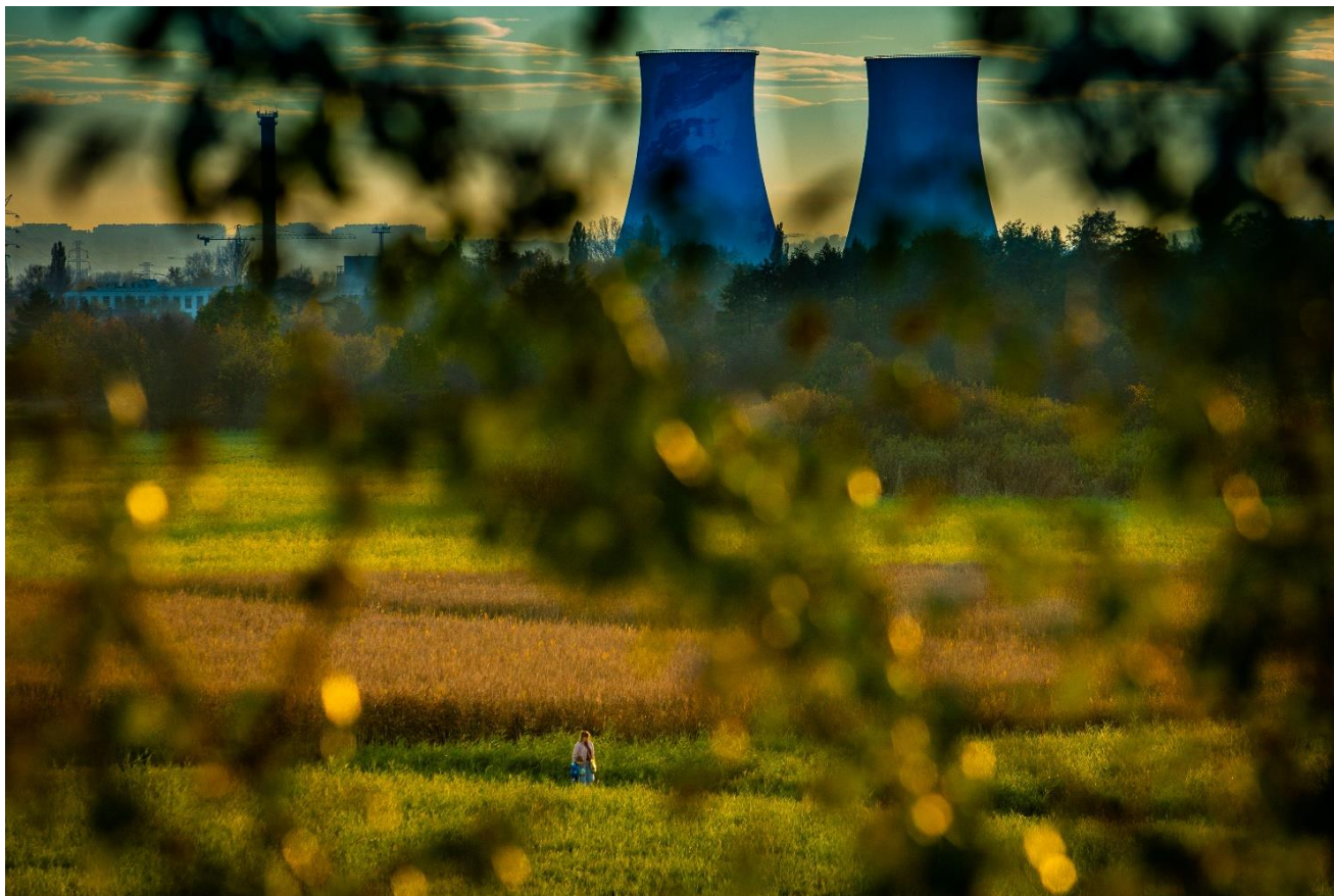
Jakub Ociepa Łąki Nowohuckie 2

Dziękujemy wszystkim autorom za nadesłane na konkurs zdjęcia.