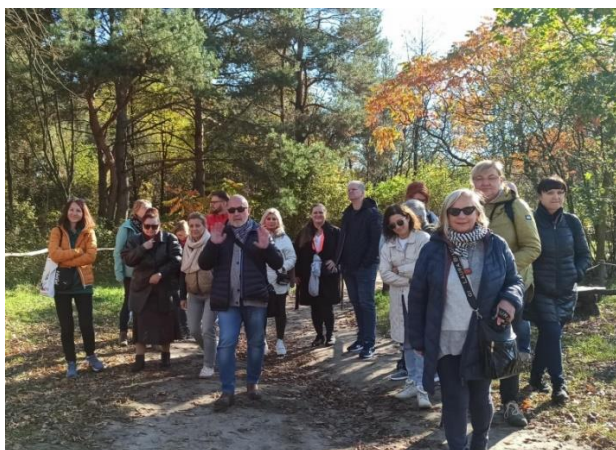
W skansenie w Tokarni